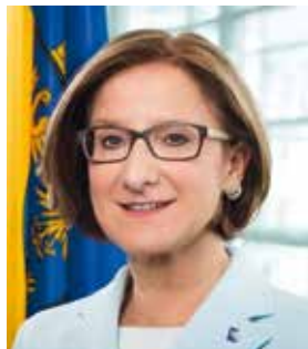
Mag.ª Johanna Mikl-Leitner Landeshauptfrau Niederösterreich

Als Landeshauptfrau von Niederösterreich freut es mich, dass in unserem Bundesland das Miteinander und die Solidarität der Generationen sehr stark gelebt werden. Das Land NÖ setzt zahlreiche Initiativen, um den Dialog der Generationen zu fördern. Der 3. Lehrgang der SeniorInnenUNI an der IMC Fachhochschule Krems verdeutlicht sowohl den hohen Stellenwert des lebenslangen Lernens, als auch den Kompetenzaufbau für ehrenamtliches Engagement und des Brückenschlags zwischen den Generationen in Niederösterreich.