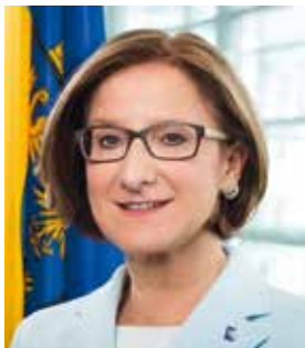
Mag.ª Johanna Mikl-Leitner Landeshauptfrau Niederösterreich

Als Landeshauptfrau von Niederösterreich freut es mich, dass in unserem Bundesland das Miteinander und die Solidarität der Generationen sehr stark gelebt werden. Das Land NÖ setzt zahlreiche Initiativen, um den Dialog der Generationen zu fördern. Der 3. Lehrgang der SeniorInnenUNI an der IMC Fachhochschule Krems verdeutlicht sowohl den hohen Stellenwert des lebenslangen Lernens, als auch den Kompetenzaufbau für ehrenamtliches Engagement und des Brückenschlags zwischen den Generationen in Niederösterreich.